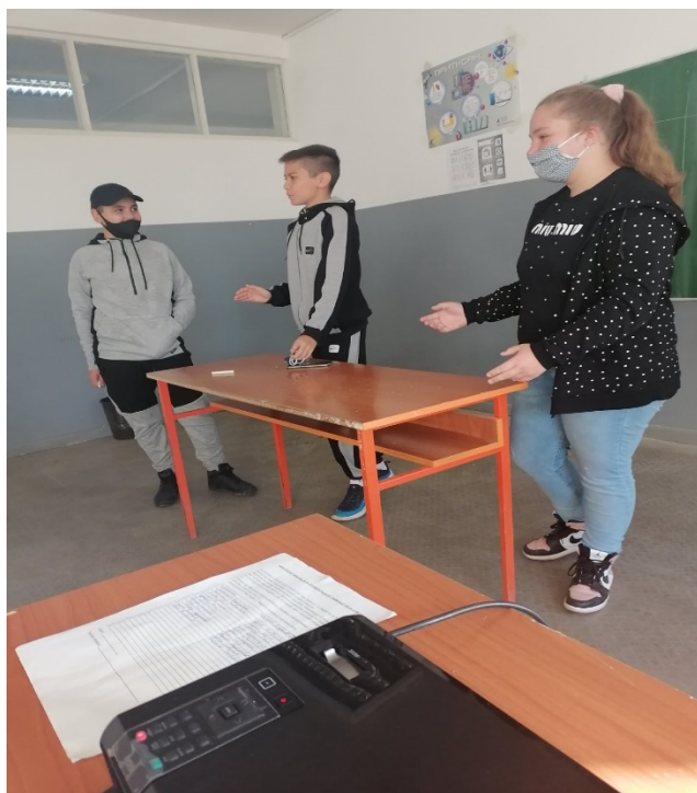
Сл.3. Фотографије са часа биологије ученика VII разреда у ОШ „Бора Станковић“ – Богојевце